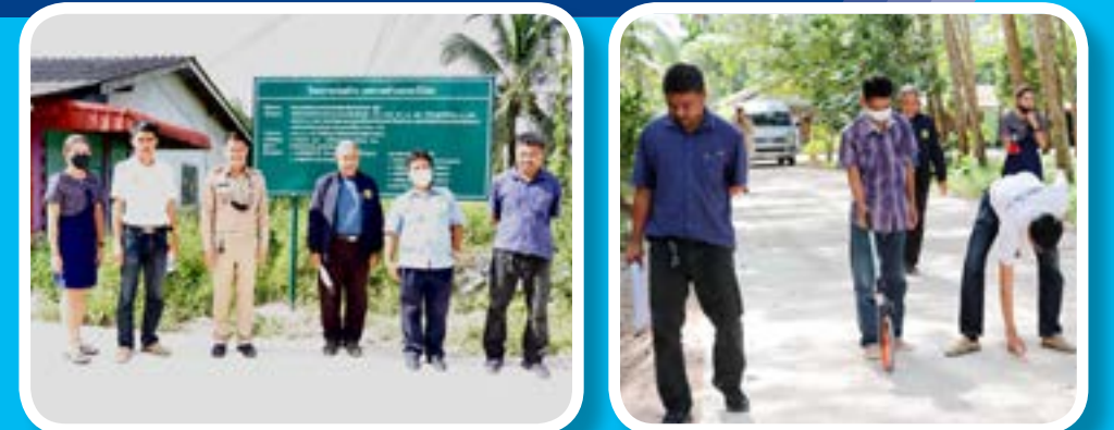
โครงการก่อสร้างถนนคอนกรีตเสริมเหล็ก ซอยน้ำพงษ์ หมู่ที่ 6 บ้านกระบี่น้อย