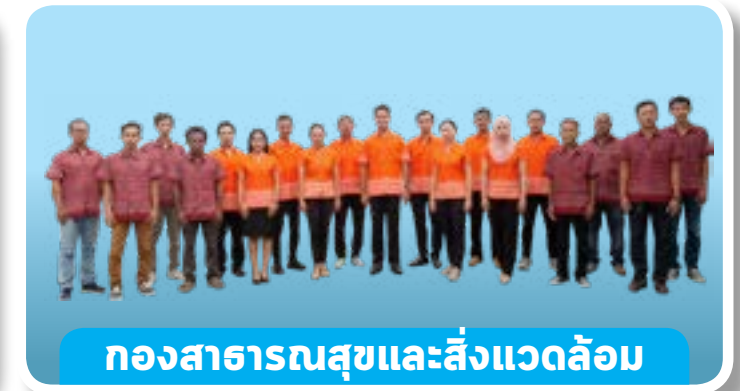
กองสาธารณสุขและสิ่งแวดล้อม