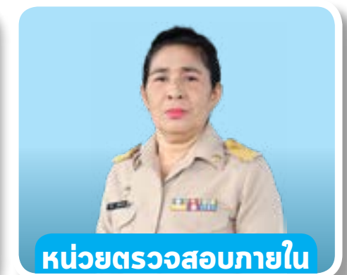
หน่วยตรวจสอบภายใน