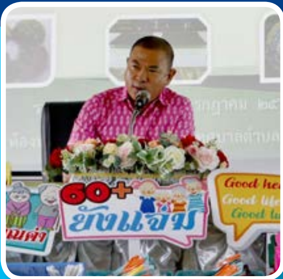
โครงการส่งเสริมความรู้และพัฒนาคุณภาพชีวิต เยาวชน สตรี ผู้สูงอายุ ผู้พิการ ผู้ด้อยโอกาสทางสังคม (ทำพรมเช็ดเท้า,ทำฝาชีแฟนซี,ทำน้ำมันไหล)

“ ยุทธศาสตร์ การพัฒนาคุณภาพชีวิต ประชาชน ให้อยู่ร่วมกันในสังคม อย่างมีความสุข ”