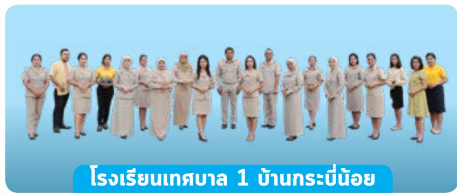
โรงเรียนเทศบาล 1 บ้านกระบี่น้อย