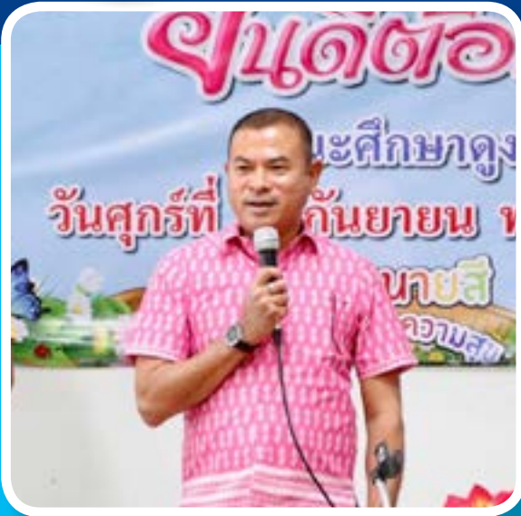
โครงการเพิ่มศักยภาพผู้สูงอายุ ประจำปีงบประมาณ พ.ศ.2565 (จัดตั้งชมรมผู้สูงอายุ,ศึกษาดูงานชมรมผู้สูงอายุ)

มุ่งสู่การบริหารจัดการโดยยึดหลักธรรมาภิบาล ประชาชนมีส่วนร่วมตอบสนองความต้องการเพื่อให้ชาวกระบี่น้อย มีความก้าวหน้าทัดเทียมอย่างยั่งยืน