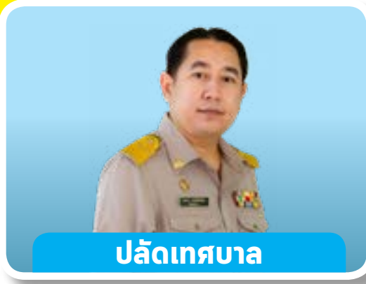
ปลัดเทศบาล