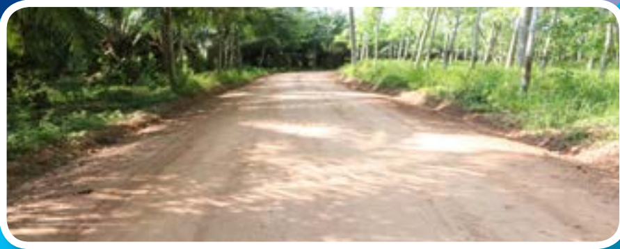
สายพุทธธรรม - เกาะยาง หมู่ที่ 13 - หมู่ที่ 5