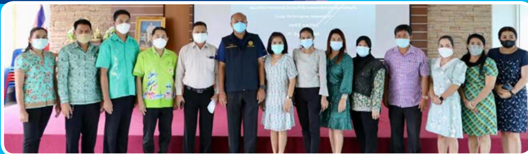
เทศบาลตำบลกระบี่น้อย ประจำปี 2565 การประเมินประสิทธิภาพขององค์กรปกครองส่วนท้องถิ่น (Local Performance Assessment : LPA) ประจำปี 2564 จำนวน 5 ด้าน ประกอบด้วย : ด้านการบริหารจัดการ ด้านการบริหารงานบุคคลและกิจการสภา ด้านการบริหารงานการเงินและการคลัง ด้านการบริการ สาธารณะและด้านธรรมาภิบาล

ส่งเสริมการมีส่วนร่วม ของทุกภาคส่วน การเปิดโอกาส ให้ประชาชนและผู้ที่เกี่ยวข้อง ทุกภาคส่วนของสังคม ได้เข้ามามีส่วนร่วมกับภาคราชการ มุ่งสู่การบริหารจัดการ โดยยึดหลักธรรมาภิบาล