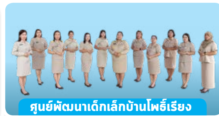
ศูนย์พัฒนาเด็กเล็กบ้านโพธิ์เรียง