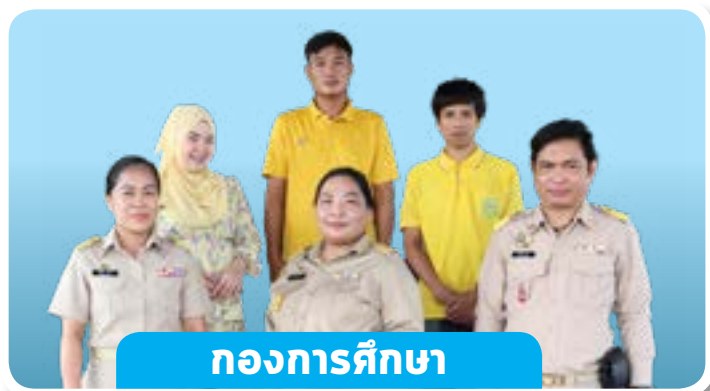
กองการศึกษา