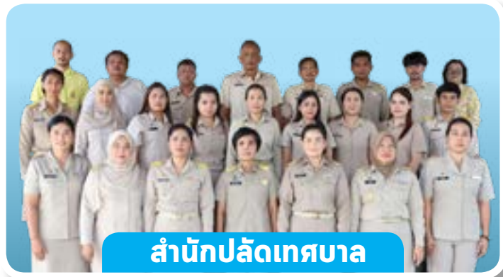
สำนักปลัดเทศบาล