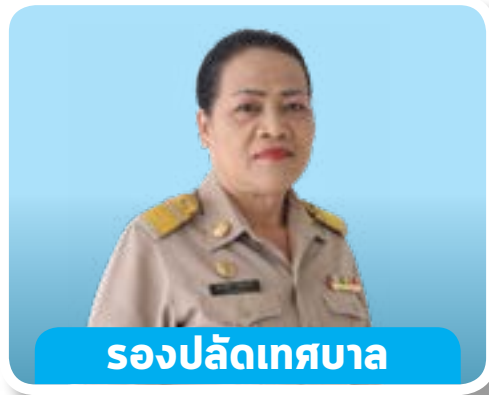
รองปลัดเทศบาล