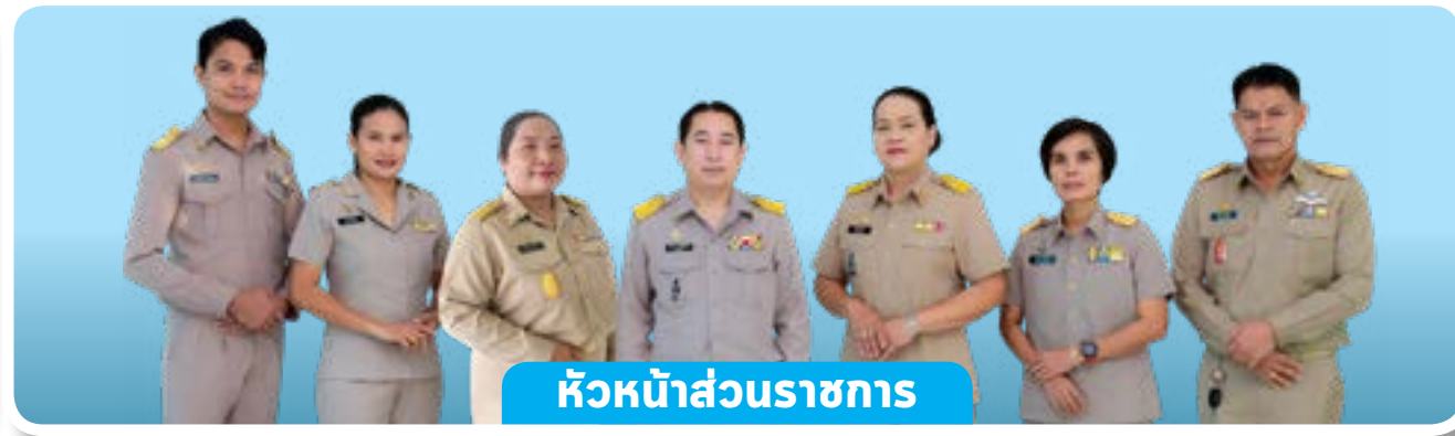
หัวหน้าส่วนราชการ